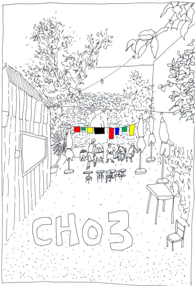
Illustration 3. Couverture du livret « CHO3 », première assemblée générale, 28 septembre 2019

Les outils de l'éducation populaire sont au cœur de chacun des moments convoqués par et pour les habitant-es. Les dessins rassemblés dans le livret ci-dessous restituent l'assemblée de création du CHO3 en septembre 2019.